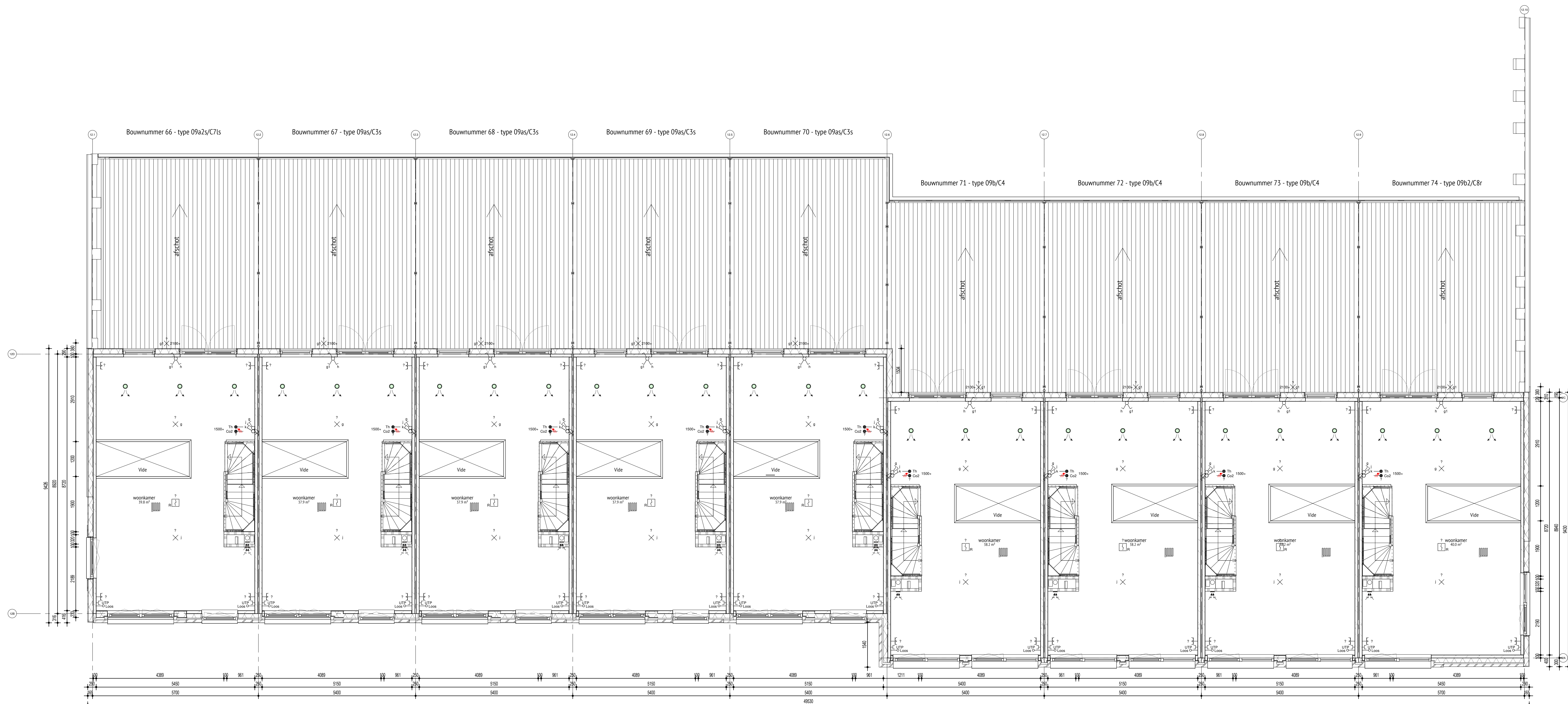
01 eerste verdieping